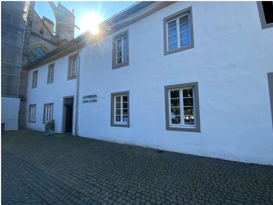
Touristinformation Altenberg