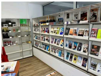
Kundenraum der Tourist-Information Dortmund