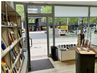
Kundenraum der Tourist-Information Dortmund