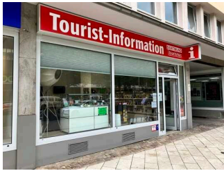
Eingangsbereich Tourist-Information Dortmund

Wir haben für Sie einige Fotos aus dem Betrieb / Angebot zusammengestellt. In den Detailberichten finden Sie weitere Fotos.