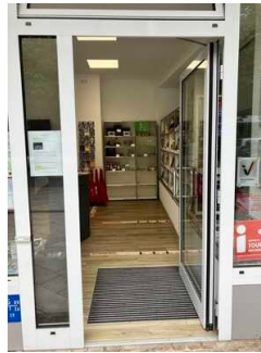
Eingangsbereich Tourist-Information Dortmund