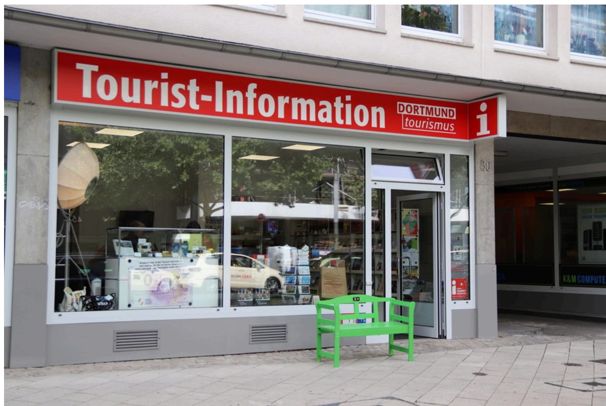
Tourist-Information Dortmund | DORTMUNDtourismus