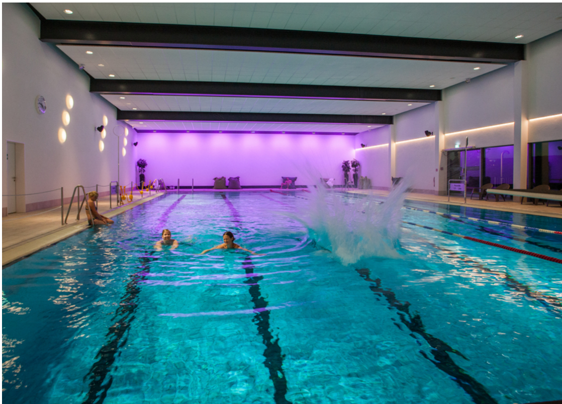
Schwimmbad Winterberg | Ferienwelt Winterberg