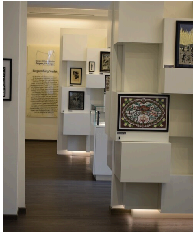
Ausstellungsraum im Scherenschnittmuseum