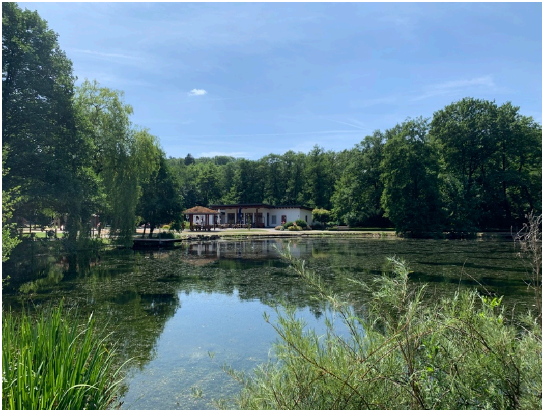
Restaurant Aatalhaus