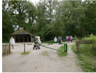
Zugang zum Zwillbrocker Venn