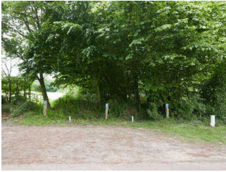
Parkplatz für Menschen mit Behinderung

Wir haben für Sie einige Fotos aus dem Betrieb / Angebot zusammengestellt. In den Detailberichten finden Sie weitere Fotos.