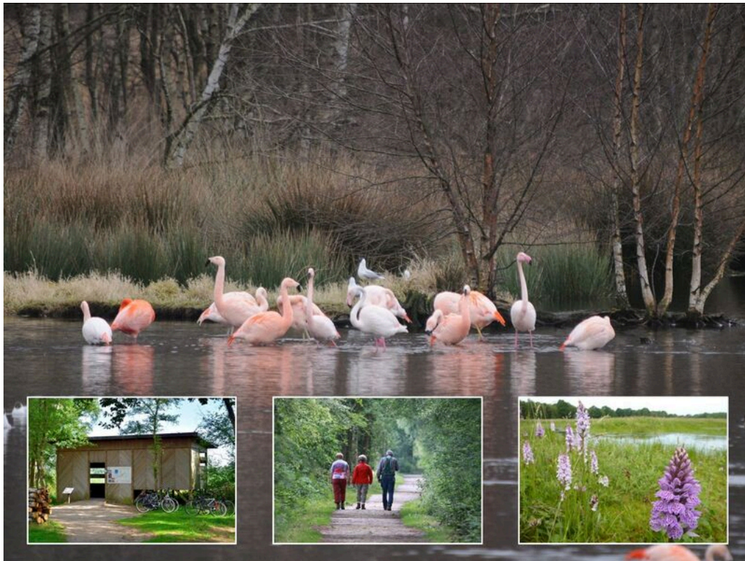
Naturschutzgebiet Zwillbrocker Venn