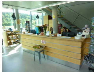
Counter / Tourist-Info