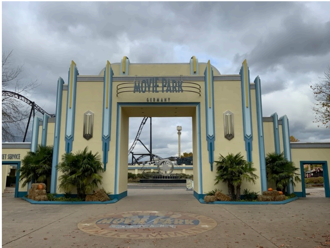
Movie Park Germany