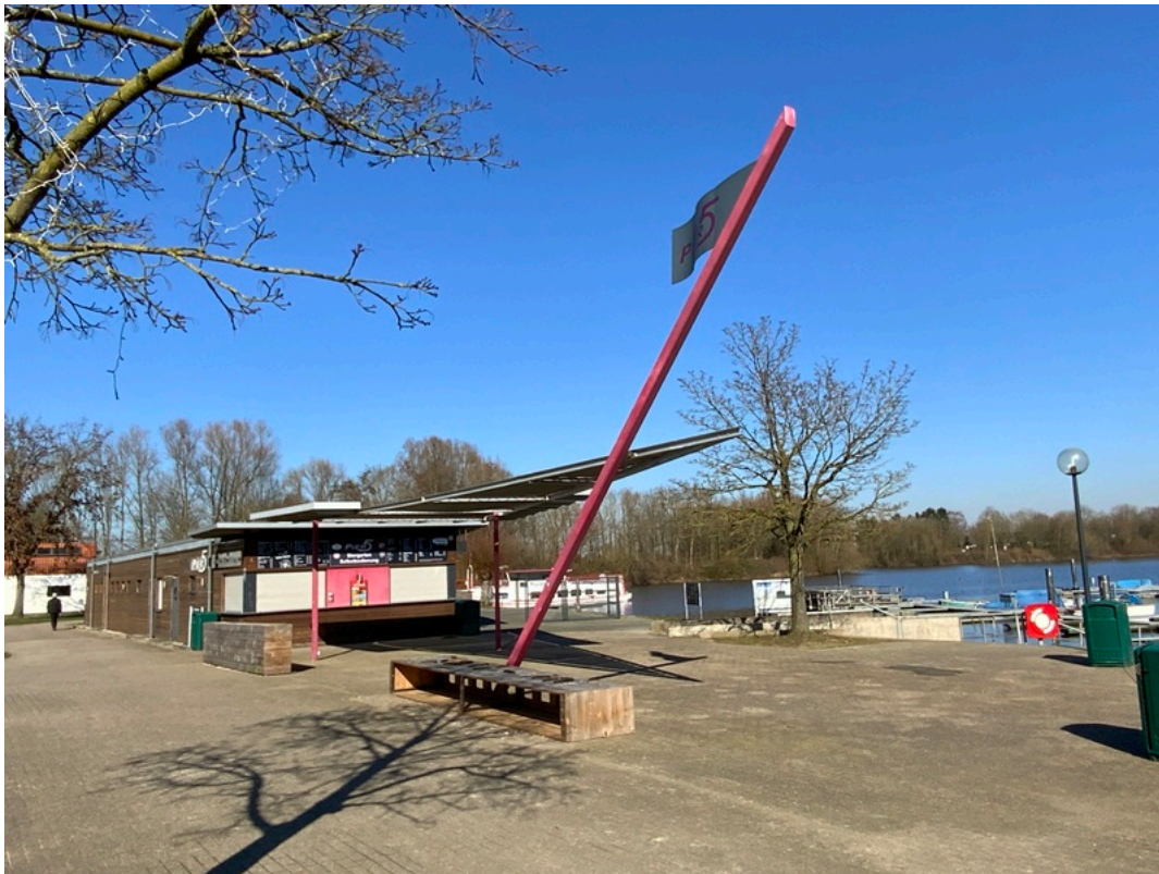
Hafen Vynen Pier 5