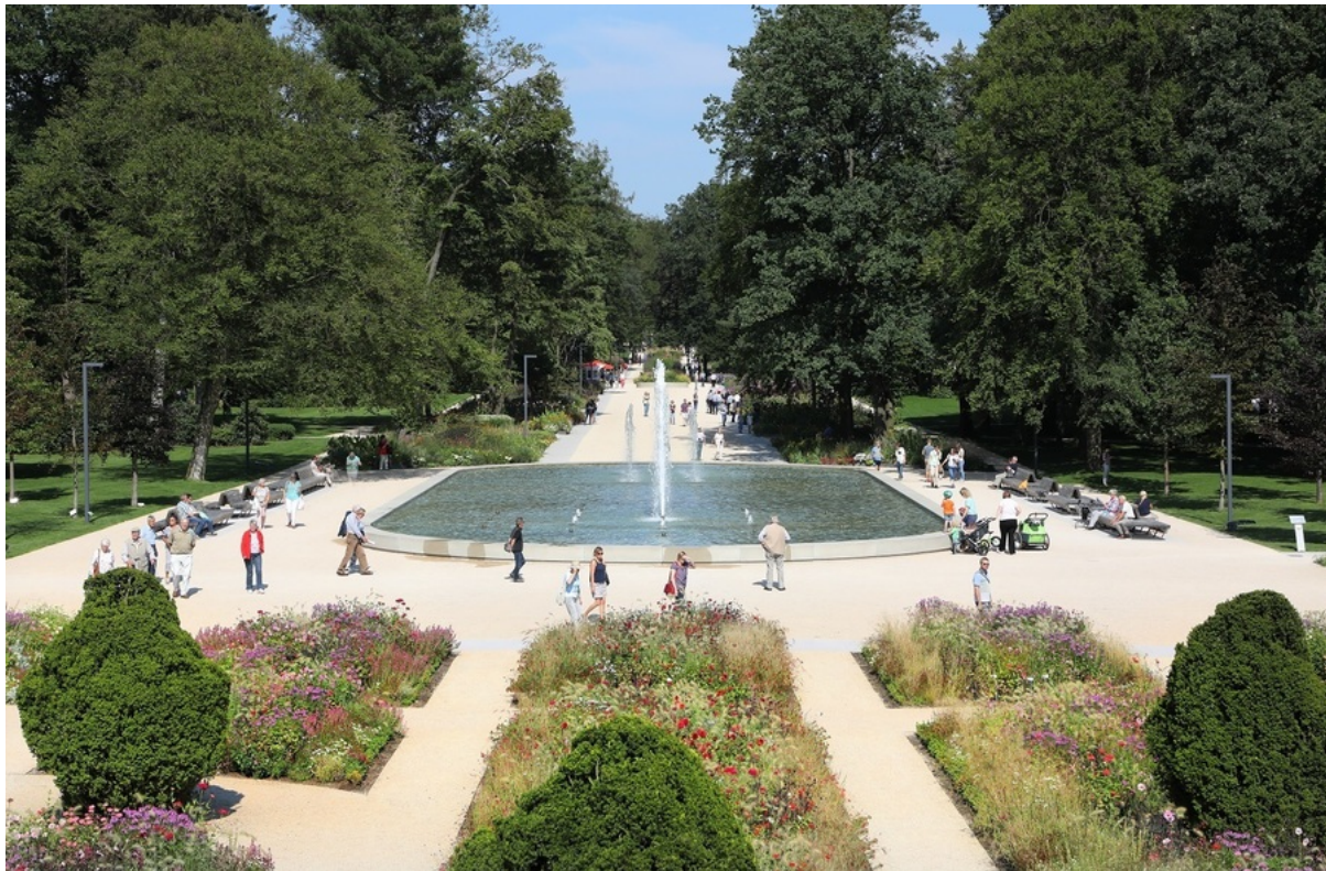
Gartenschau Bad Lippspringe | www.PHOMAX.de