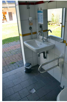
WC, Dusche, Waschraum an der Zeltwiese