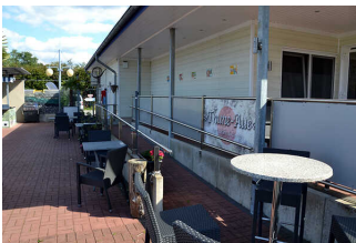
Restaurant Thune- Aue