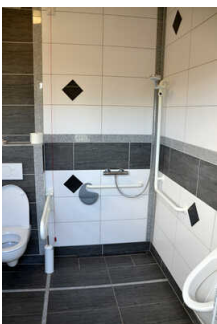
WC, Dusche, Waschraum am Restaurant