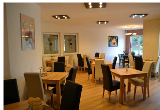
Restaurant Thune- Aue