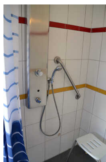
WC, Dusche, Waschraum an der Zeltwiese