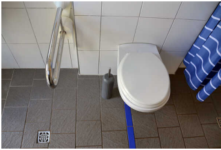
WC, Dusche, Waschraum an der Zeltwiese