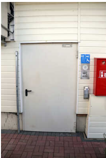
WC, Dusche, Waschraum am Restaurant