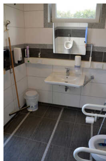
WC, Dusche, Waschraum am Restaurant