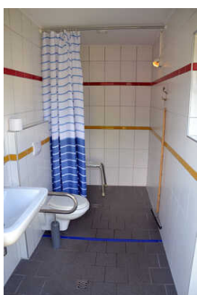
WC, Dusche, Waschraum an der Zeltwiese