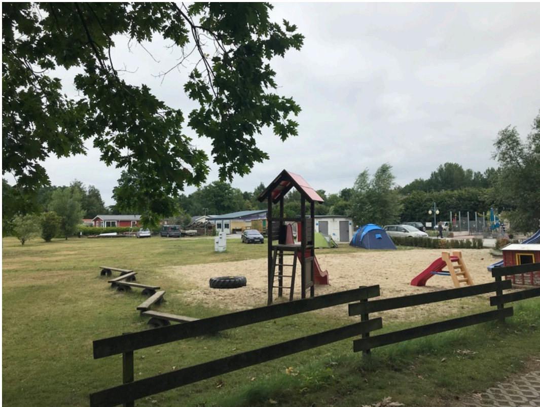
Freizeit- und Wohnpark am Lippesee | ©Benjamin Suthe (2019)