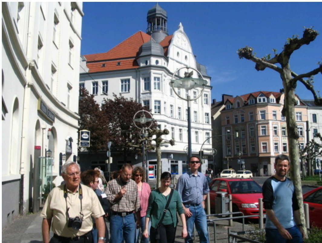
Stadtteilführung Stern des Nordens | BorsigplatzVerführungen