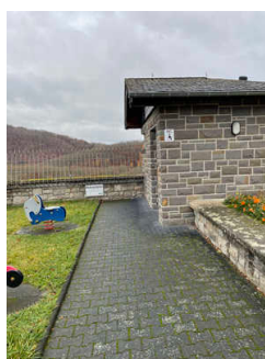
Öffentliches WC an der Urfttalsperre