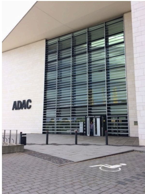
Eingangsbereich mit Blick vom Parkplatz für Menschen mit Behinderungen auf den Eingangsbereich