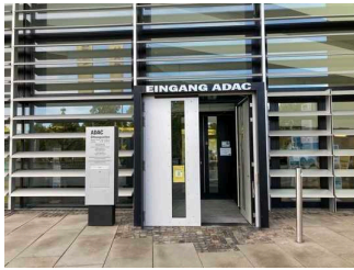
Eingangstür mit Infotafel

Wir haben für Sie einige Fotos aus dem Betrieb / Angebot zusammengestellt. In den Detailberichten finden Sie weitere Fotos.